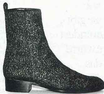
Kommt nach Disco jetzt das Glamrock-Revival? Erste Vorboten könnten die Boots des neuen Mailänder Labels Memento Duo sein.