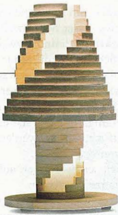
Die Holzleuchte »Babele« kann man drehen und wenden, wie man will. designmid.it